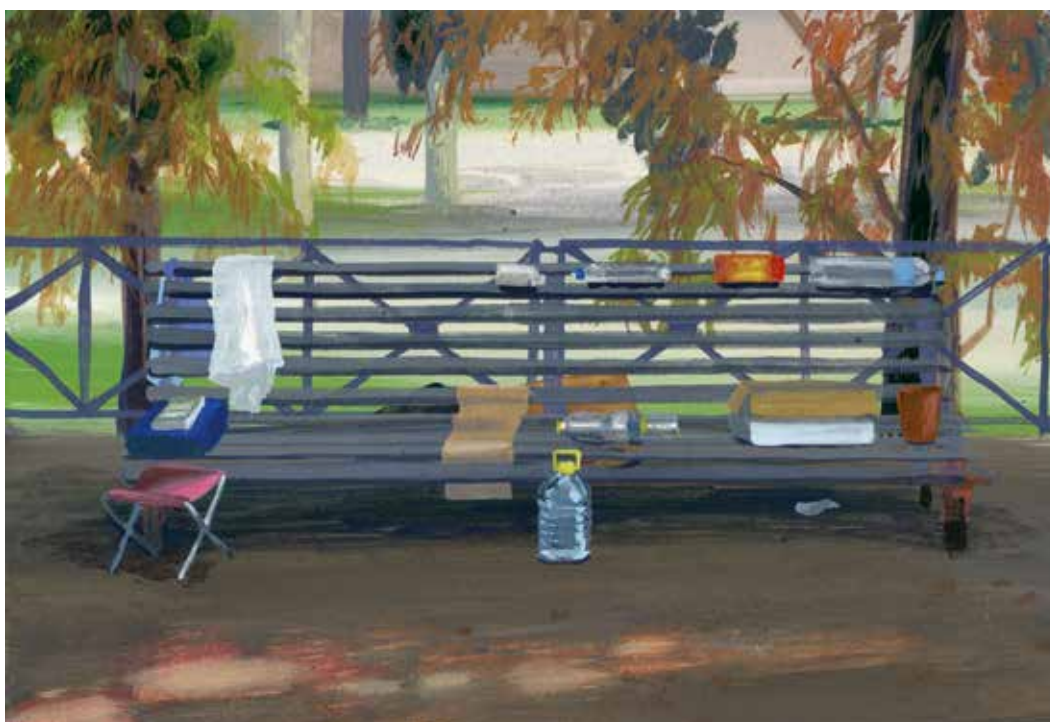
'00193 Roma RM' (uit de Postcodeserie), 2018, eitempera op papier, 18 x 26 cm, part. coll.

dicht genaderd zijn. Dat ze in staat zijn om met bijna niets een onderkomen te maken, bewonder ik. Ik schilder die plekken met een enorme liefde en aandacht. Ik zie mijzelf als een soort hofschilder van de have-nots.”