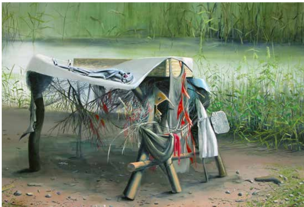
'Schuld en boete', 2011, eitempera op doek/paneel, 150 x 245 cm, part. coll.

Zijn trage werkwijze is een stil protest tegen de vluchtigheid waarmee we het nieuws consumeren en een pleidooi voor aandacht en duurzaamheid. "Ik geloof dat de kunstenaar zoekt naar iets dat de zicht-