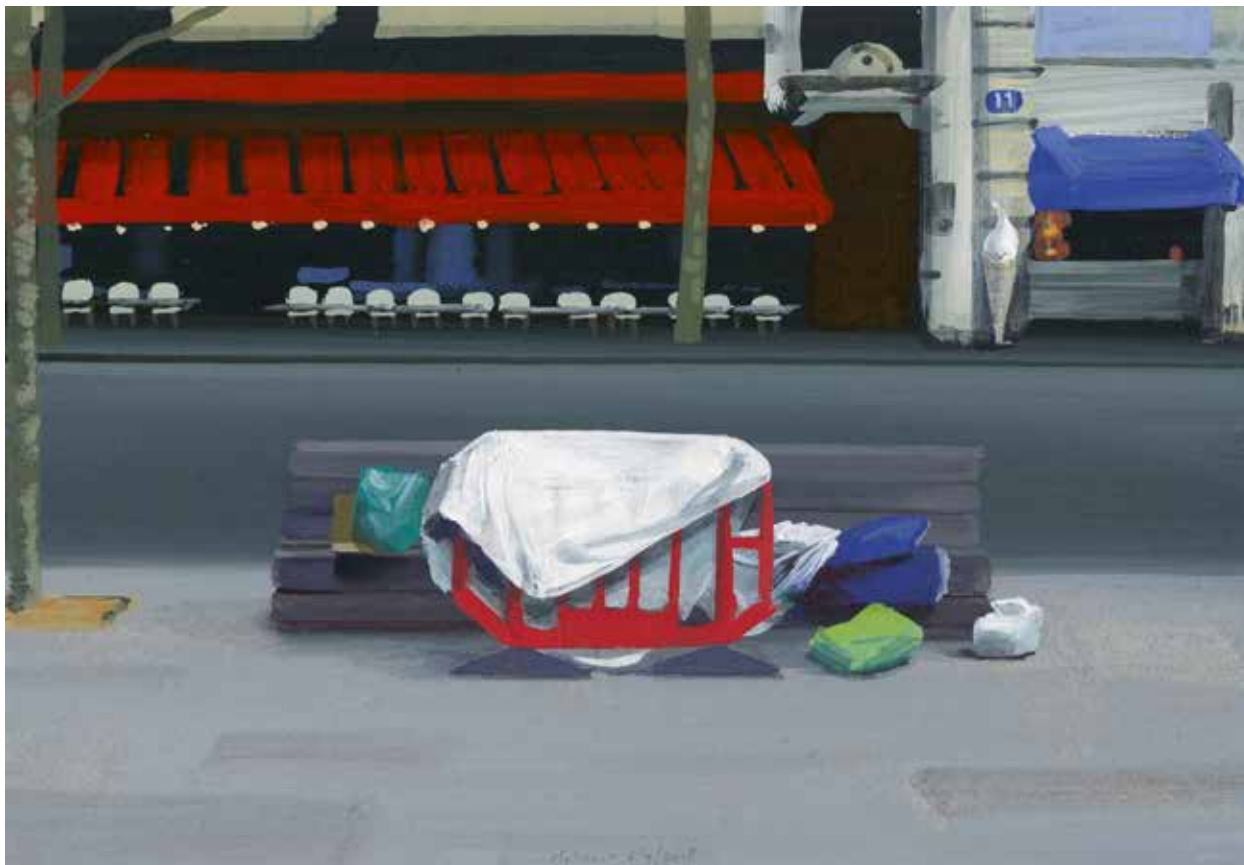
'75003 Paris' (uit de Postcodeserie), 2018, eitempera op papier, 18 x 26 cm, collectie kunstenaar

Zijn atelier, op de benedenverdieping van een negentiende-eeuws schoolgebouw in de Rotterdamse wijk Kralingen, is een hoge ruimte met een vloer van donkerbruine planken. Het is opvallend leeg en opgeruimd. Alles straalt orde en rust uit. Het vuur waarmee hij spreekt over de overweldigende problemen van onze tijd lijkt in tegenspraak met de kalmte van zijn gebaren, zijn zorgvuldige wijze van formuleren en zijn onberispelijke kleding. In een inbouwkast staan rijen glazen potten, gevuld met pigmentpoeders in tientallen kleuren.