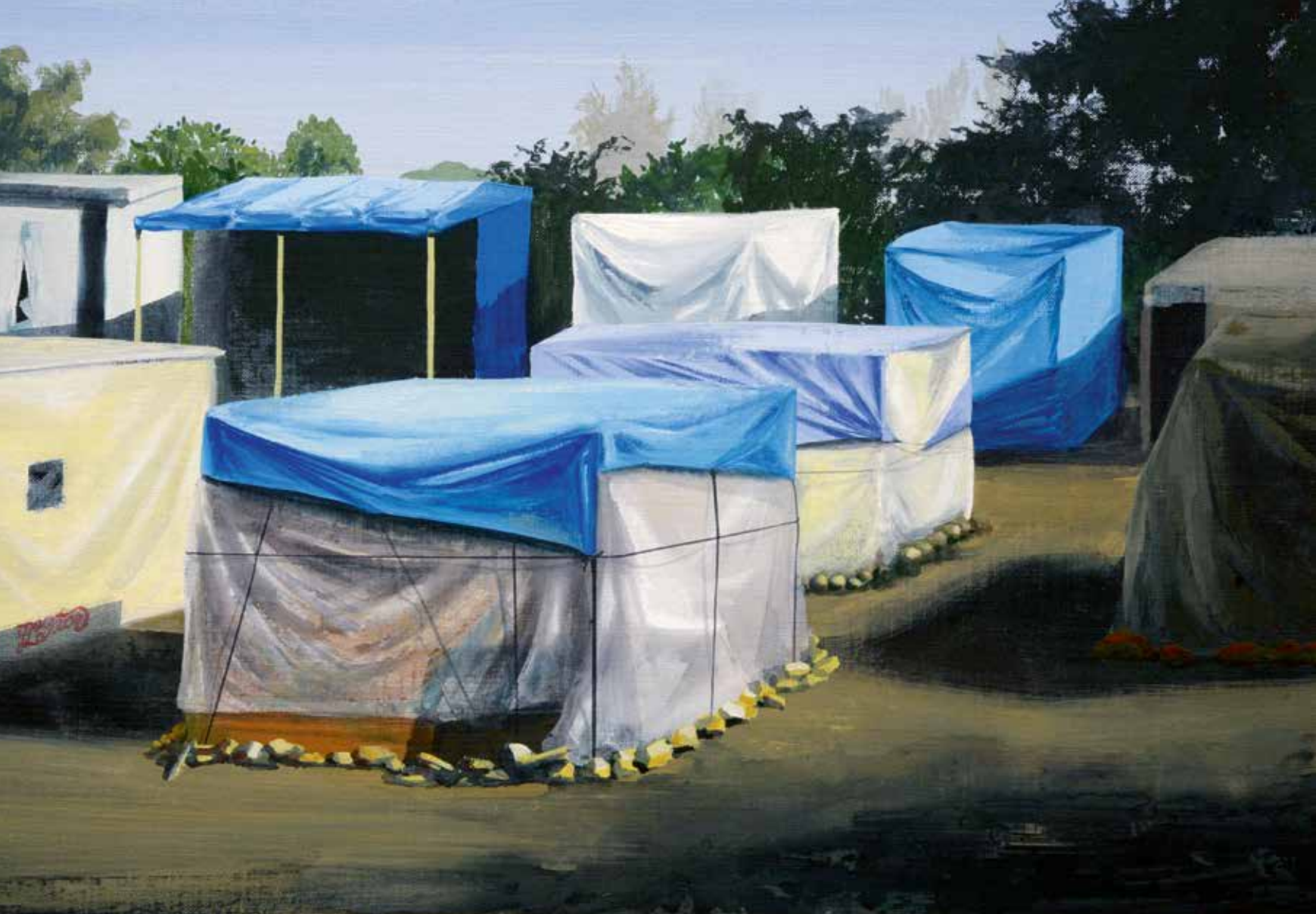
'Hotel Sudan' (uit de serie Home-made), 2017, eitempera op doek/paneel, 50 x 81 cm, collectie kunstenaar