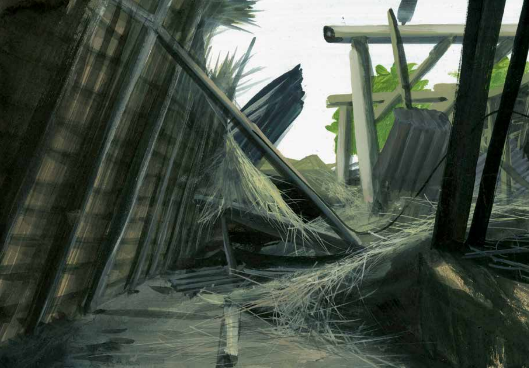
'#168 aarde 16/11/2014' (uit de serie World Stress Painting), 2014, eitempera op papier, 18 x 26 cm, part. coll.

bare werkelijkheid overstijgt. Die kranterfotografie is concreet en tijdelijk, het schilderij dat ik erop baseer moet iets universeels uitdrukken, iets essentieels verbeelden."