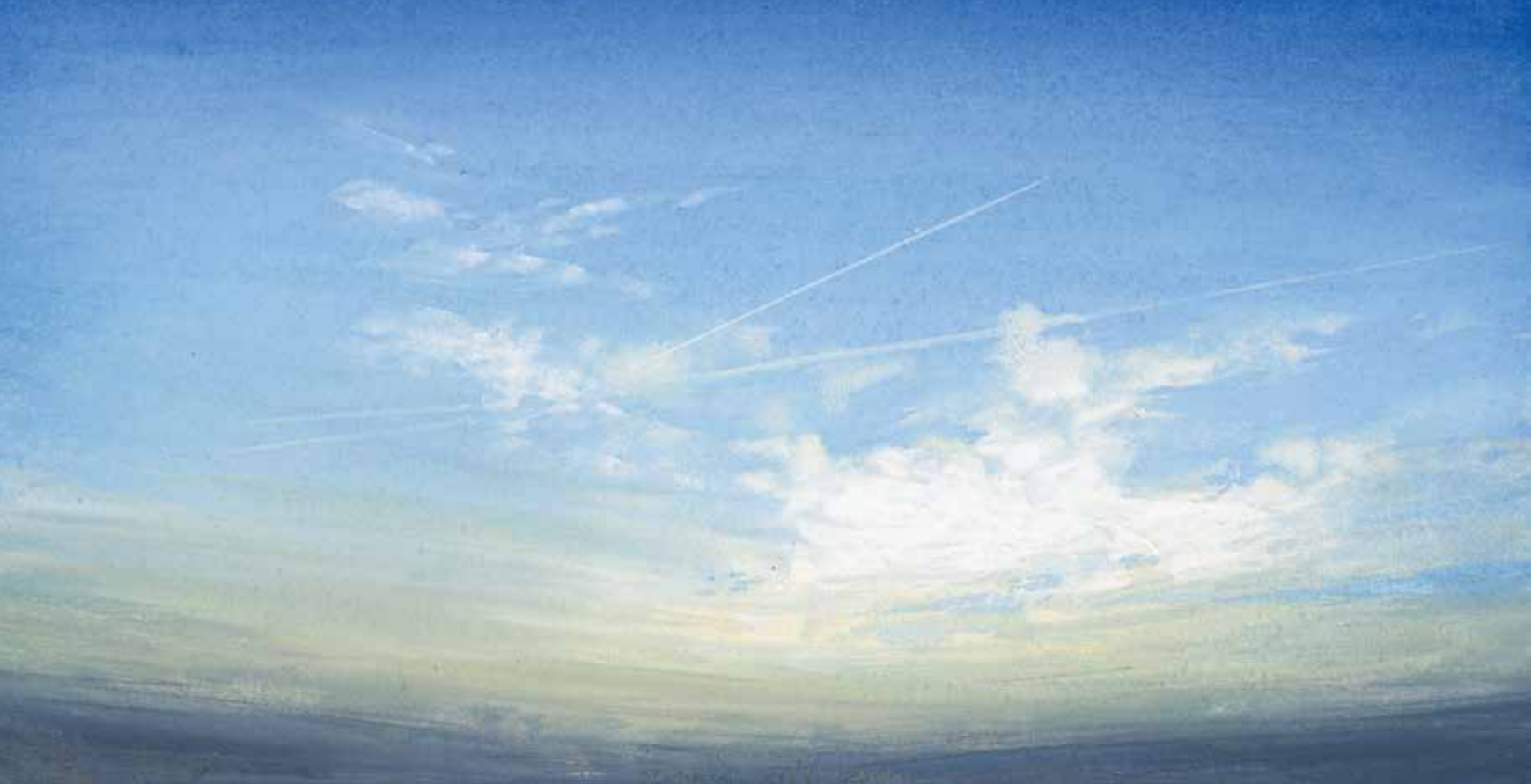
'Phoebus #148', 2019, eitempera op papier, 18 x 26 cm, collectie kunstenaar

'IN DE LUCHT SPEELT HET GROOTSTE DRAMA ZICH AF. MAAR JE ZIET HET NIET!'